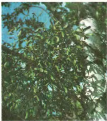
1104. Омела біла.